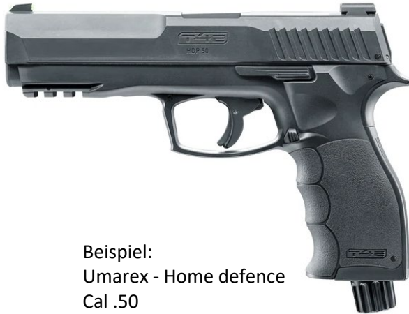
Beispiel: Umarex - Home defence Cal .50